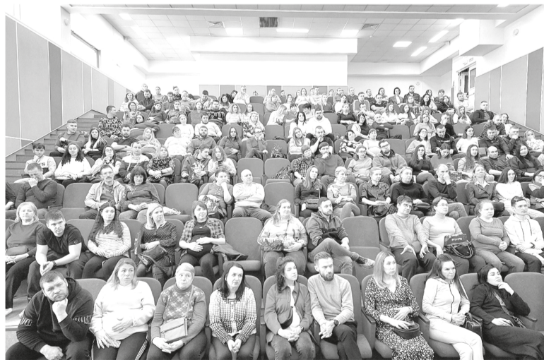
День открытых дверей в Перинатальном центре

Тенденция совместных родов находится на подъёме. В ближайшие годы около 30–40 процентов пар будут отправляться в родильное отделение вместе.