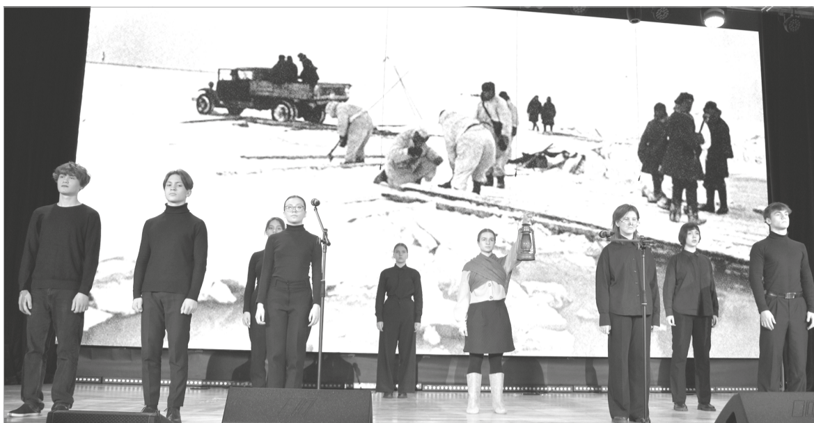
«Дорога жизни» по льду Ладожского озера стала спасением для ленинградцев