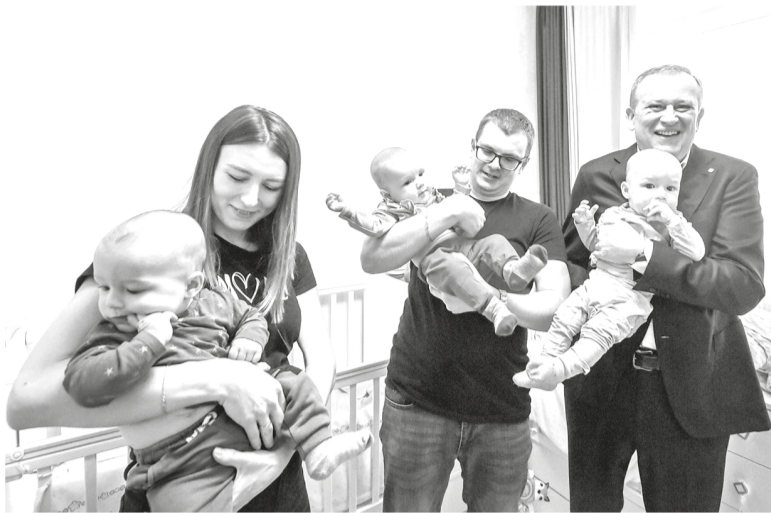
Александр Дрозденко на встрече с многодетными родителями