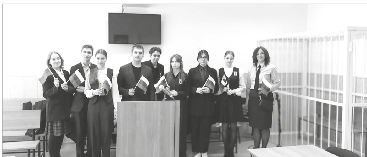
Экскурсия для юных юристов в Лодейнопольский городской суд

Уже после победы мы побывали в нашем городском суде. Нам показали залы, где проходят судебные заседания по гражданским и уголовным делам, современную технику, которой оснащены некоторые залы, познакомили с коллективом суда.