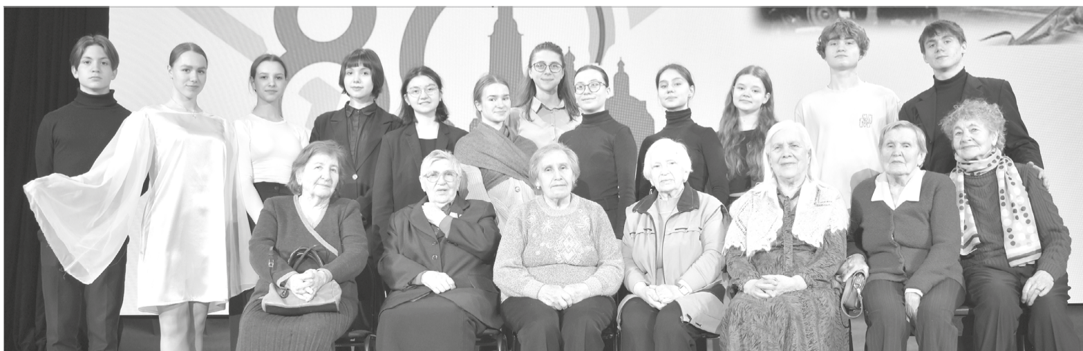
Артисты школьного театра с почётными гостями, ветеранами, детьми войны